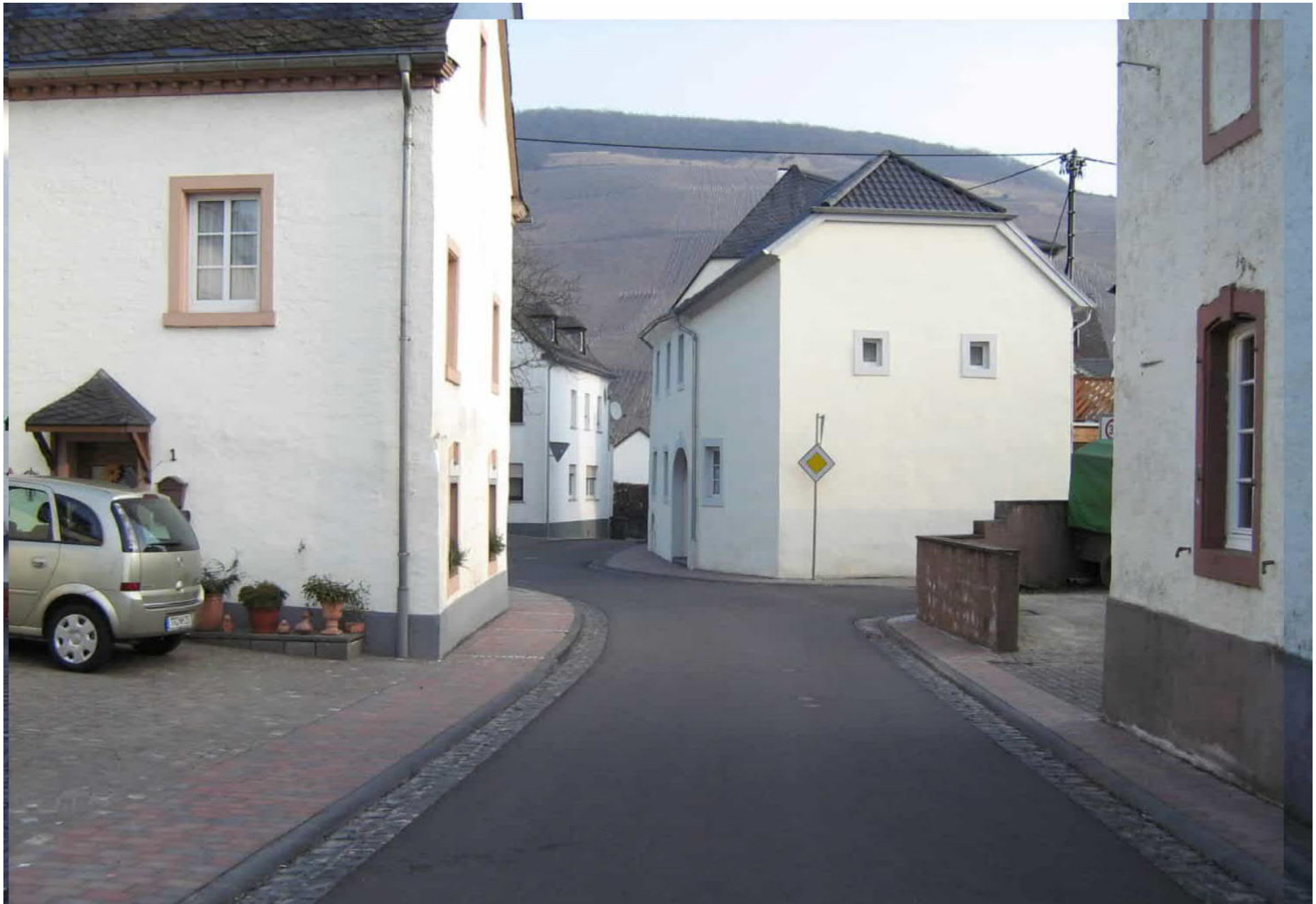
Beispiel einer ausgebauten Ortsdurchfahrt in Longuich