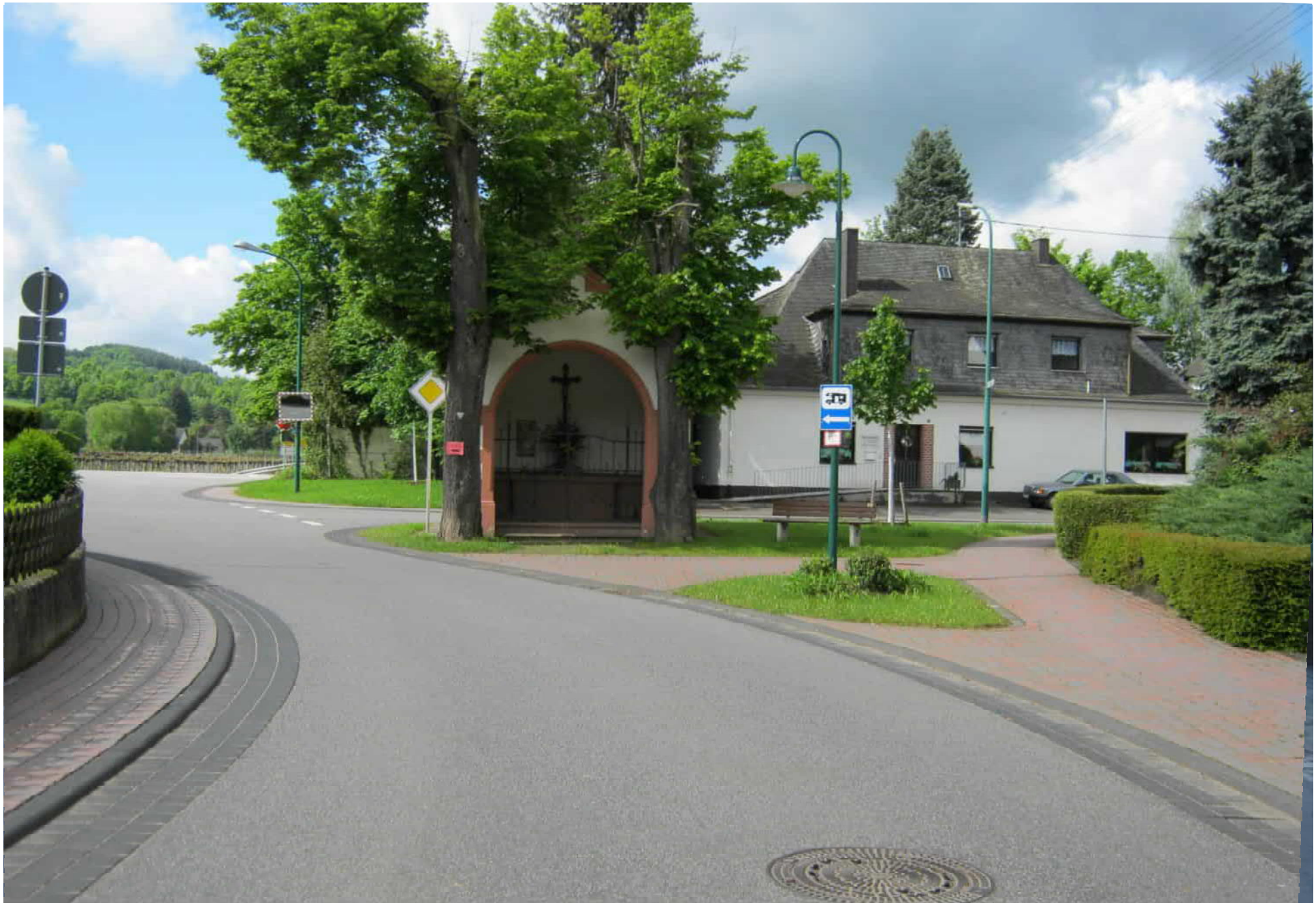
Beispiel einer ausgebauten Ortsdurchfahrt in Longuich