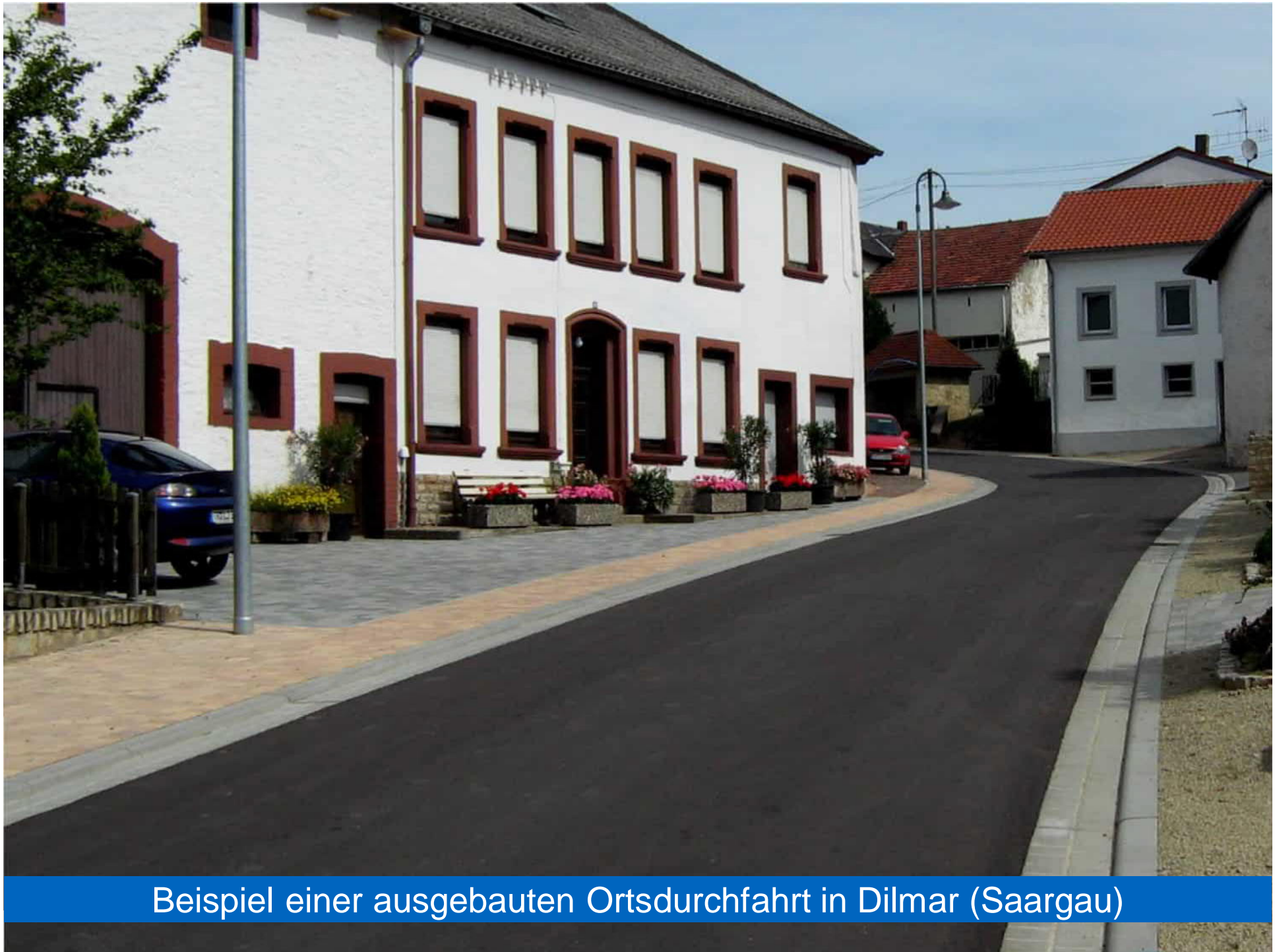
Beispiel einer ausgebauten Ortsdurchfahrt in Dilmars (Saargau)